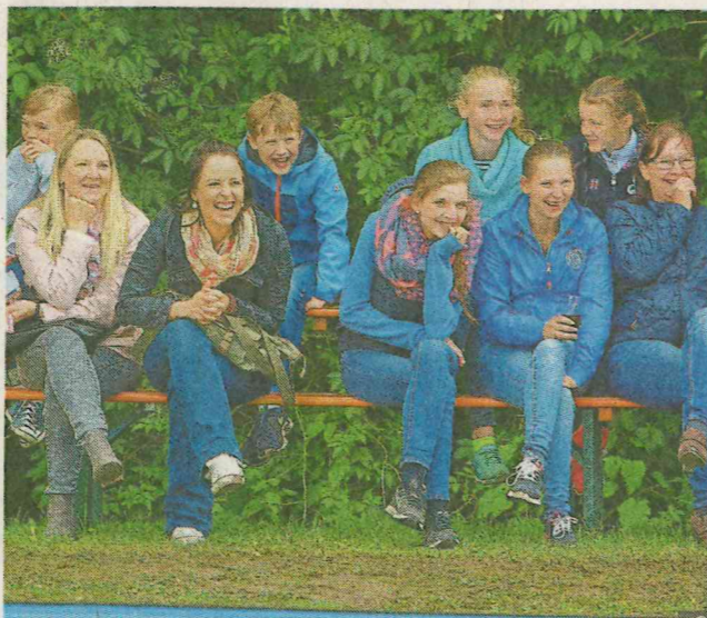
Die Zuschauer bekamen während der Reitertage eine Menge geboten.