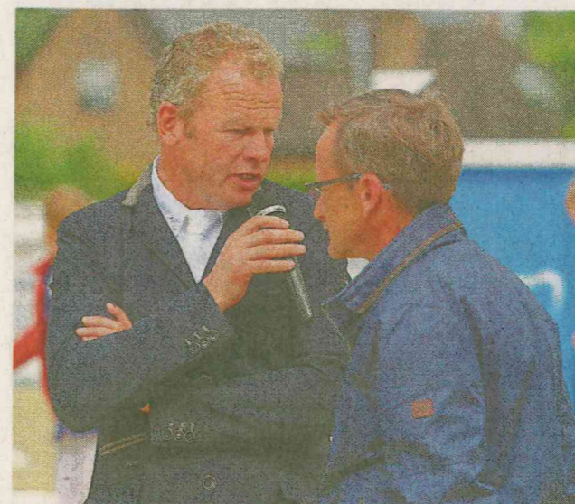
Der zweifache Olympiasieger Lars Nieberg (l.) lobte die exzellenten Platzverhältnisse.